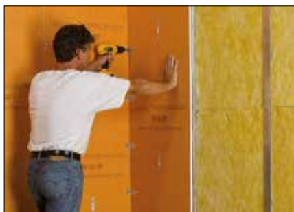
Su qualsiasi struttura fissa