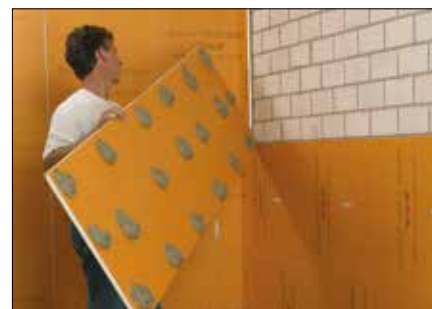
Su pareti grezze