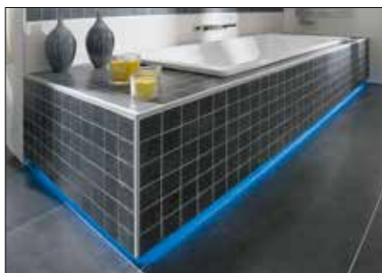
Per il tamponamento di vasche da bagno