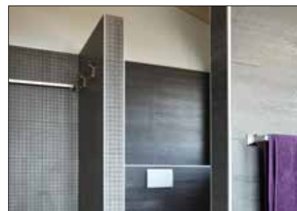
Per realizzare pareti divisorie