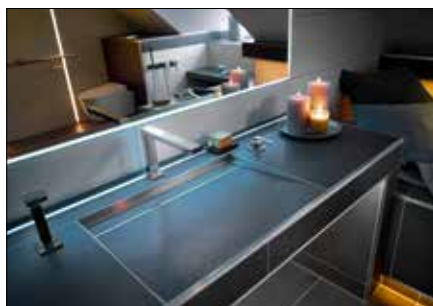
Per la realizzazione di piani per lavabi