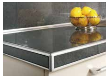
Per piani di cucine